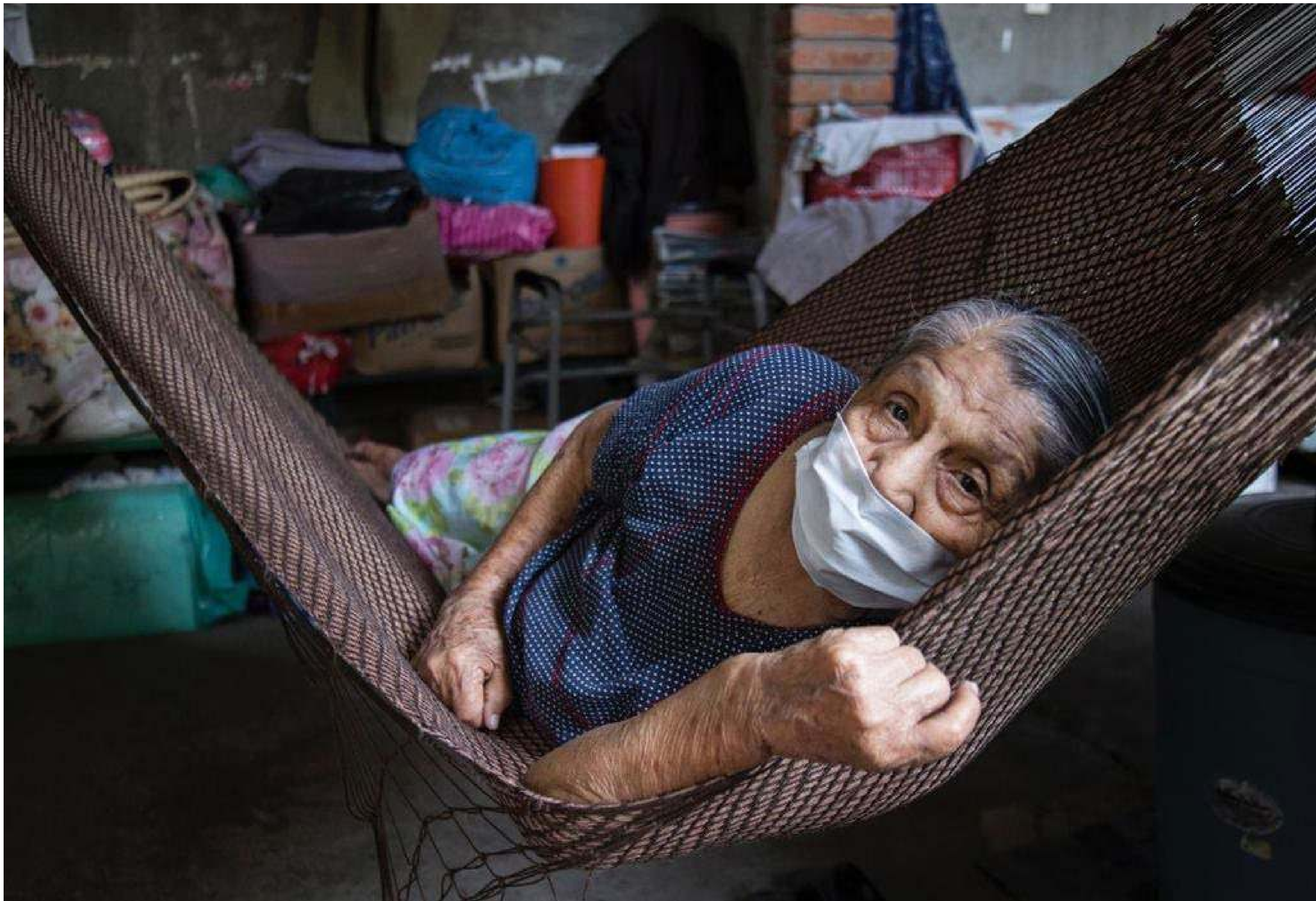
Serie: Pandemia, Luis Villalobos. México, 2020.