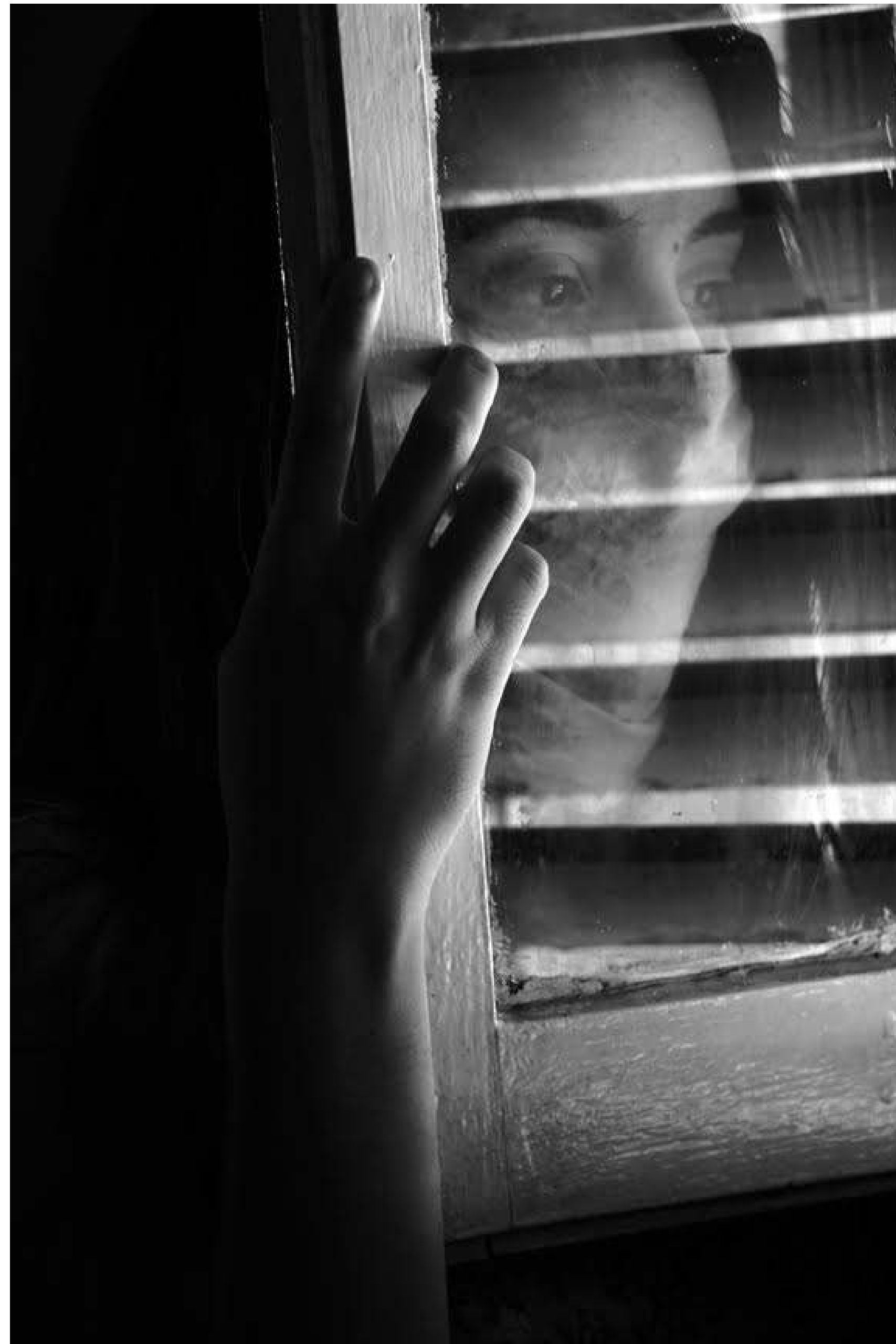
Serie: Virgen a solas, Lisbet Goenaga. Cuba, 2020.