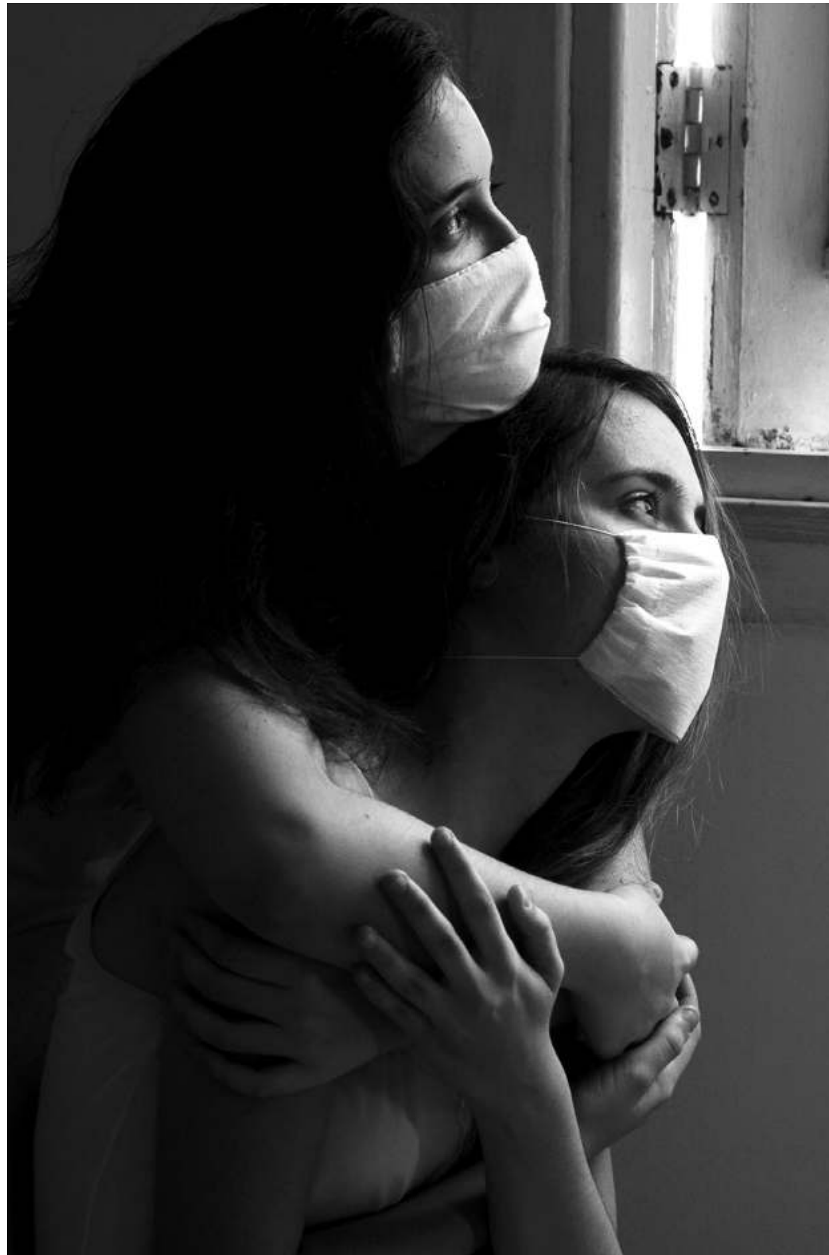
Serie: Virgen a solas , Lisbet Goenaga. Cuba, 2020.