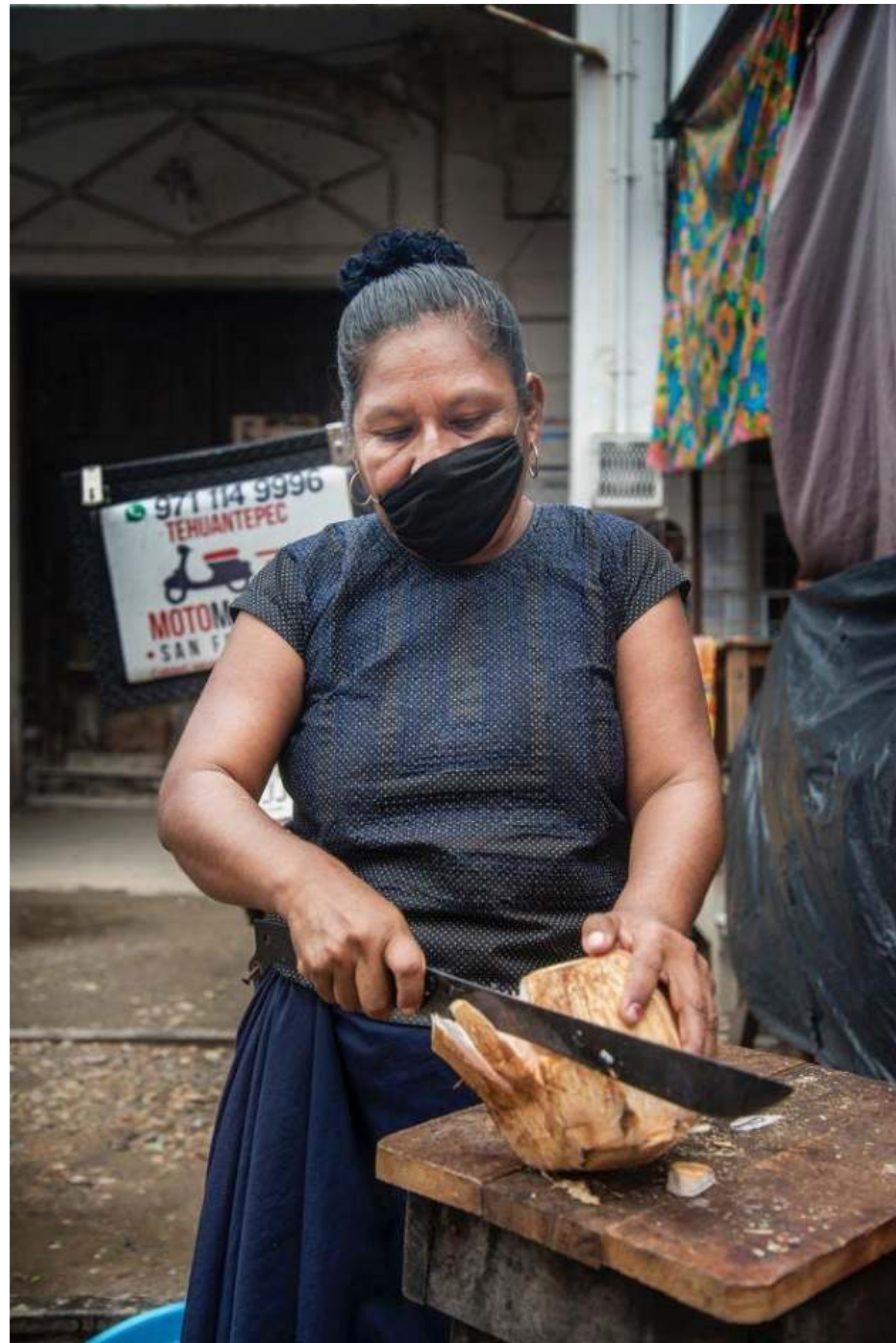
Serie: Pandemia, Luis Villalobos. México, 2020.