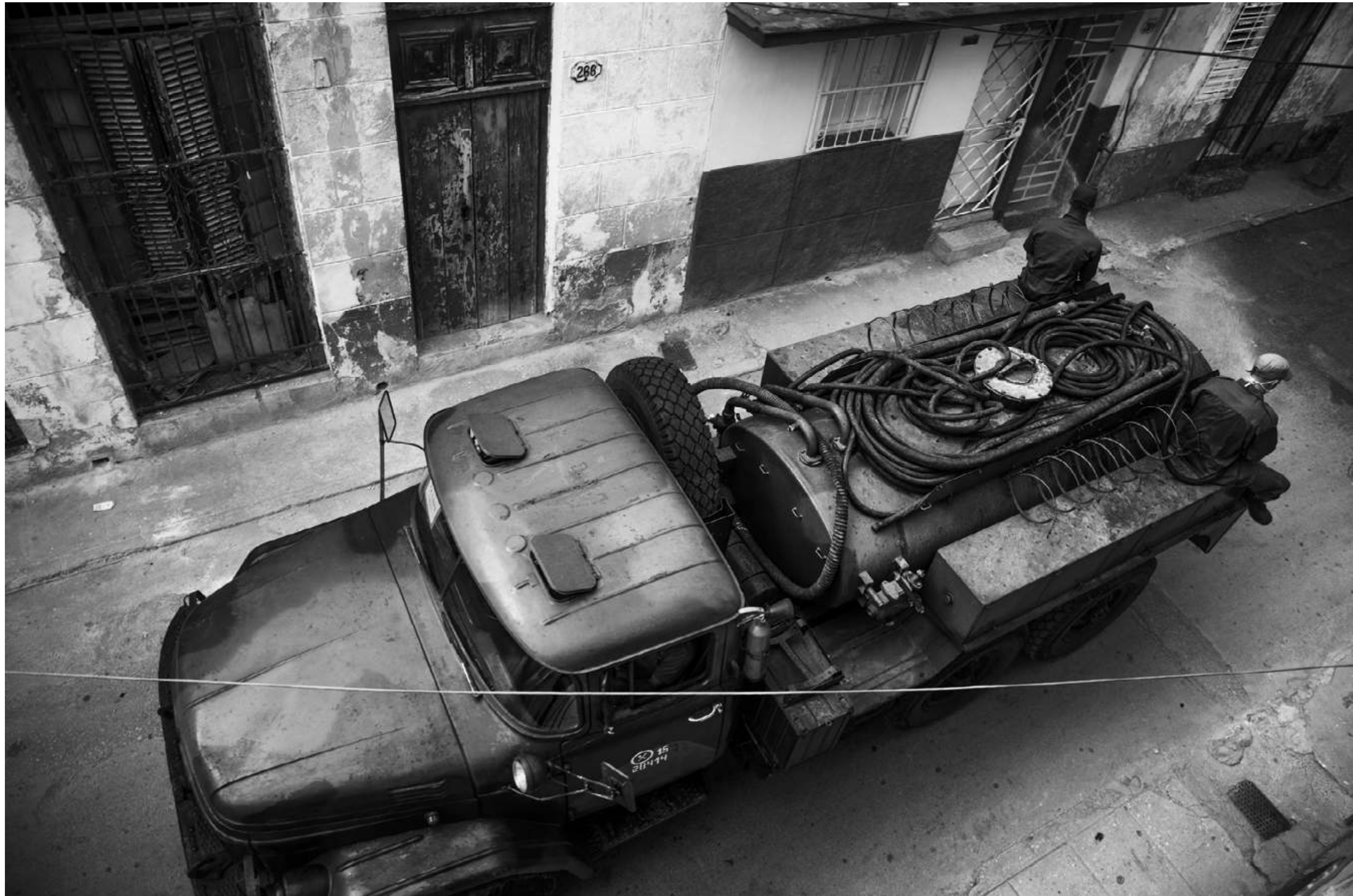
Cloro , Leysis Quesada. Cuba 2020.