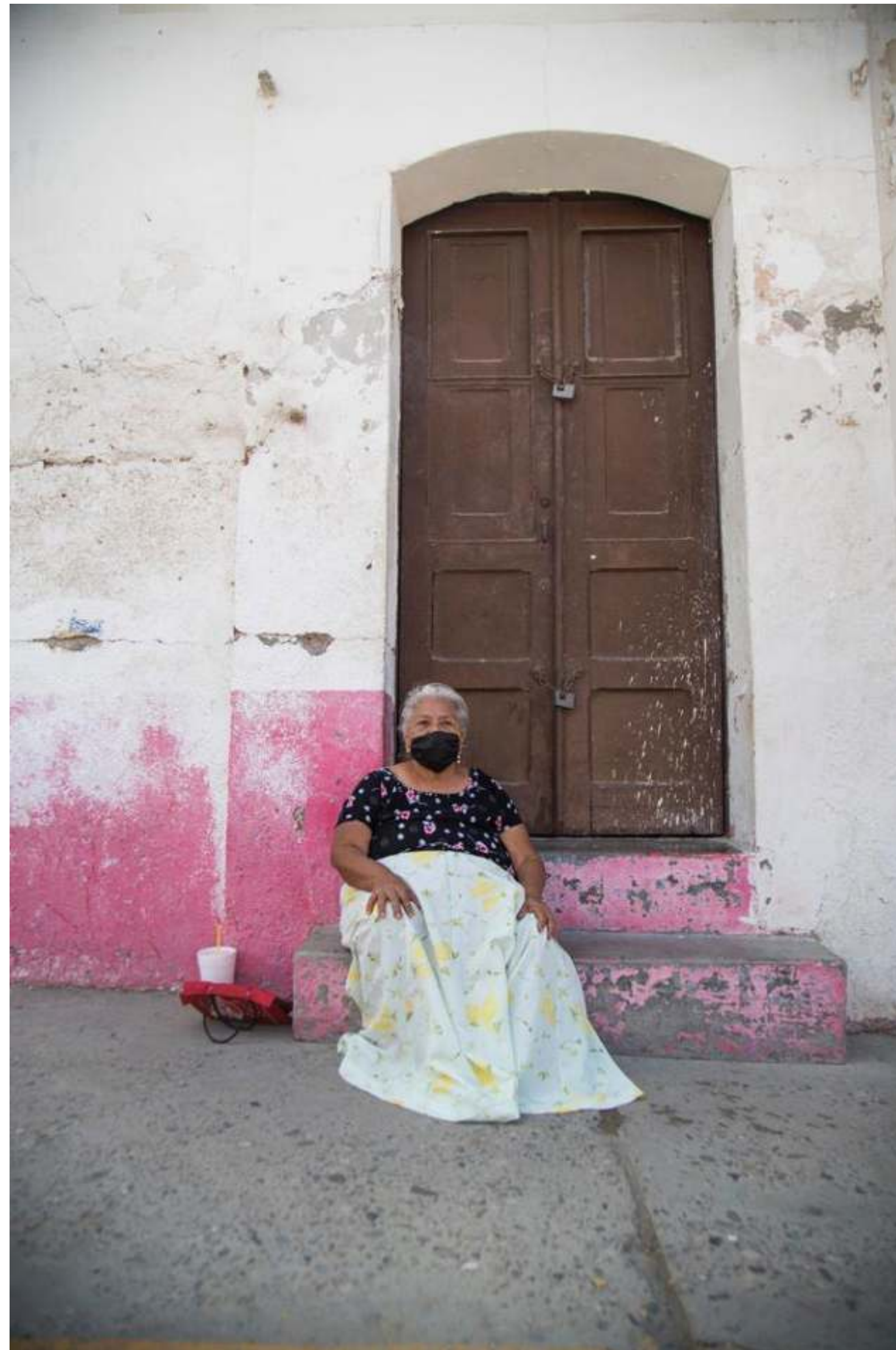
Serie: Pandemia, Luis Villalobos. México, 2020.