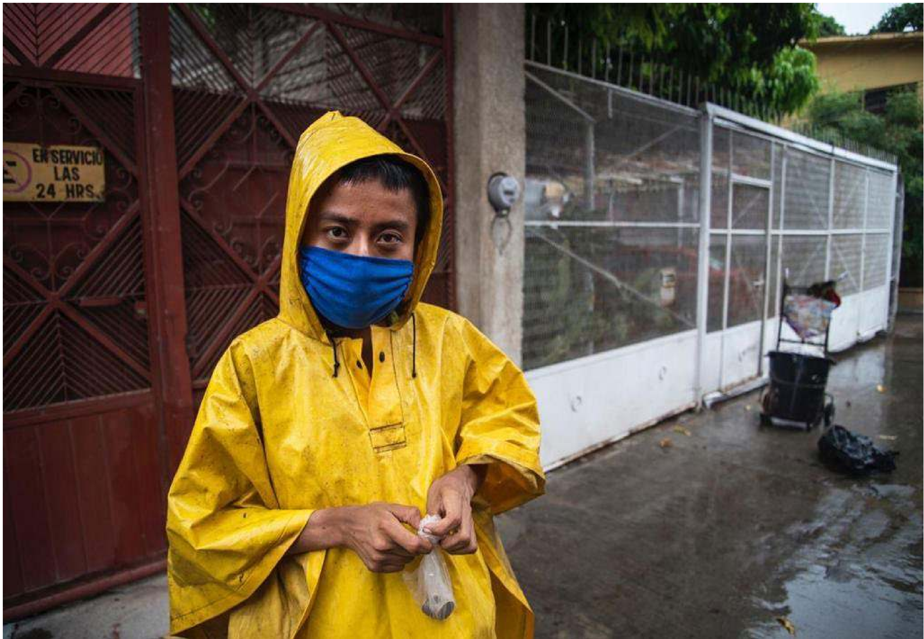
Serie: Pandemia , Luis Villalobos. México, 2020.