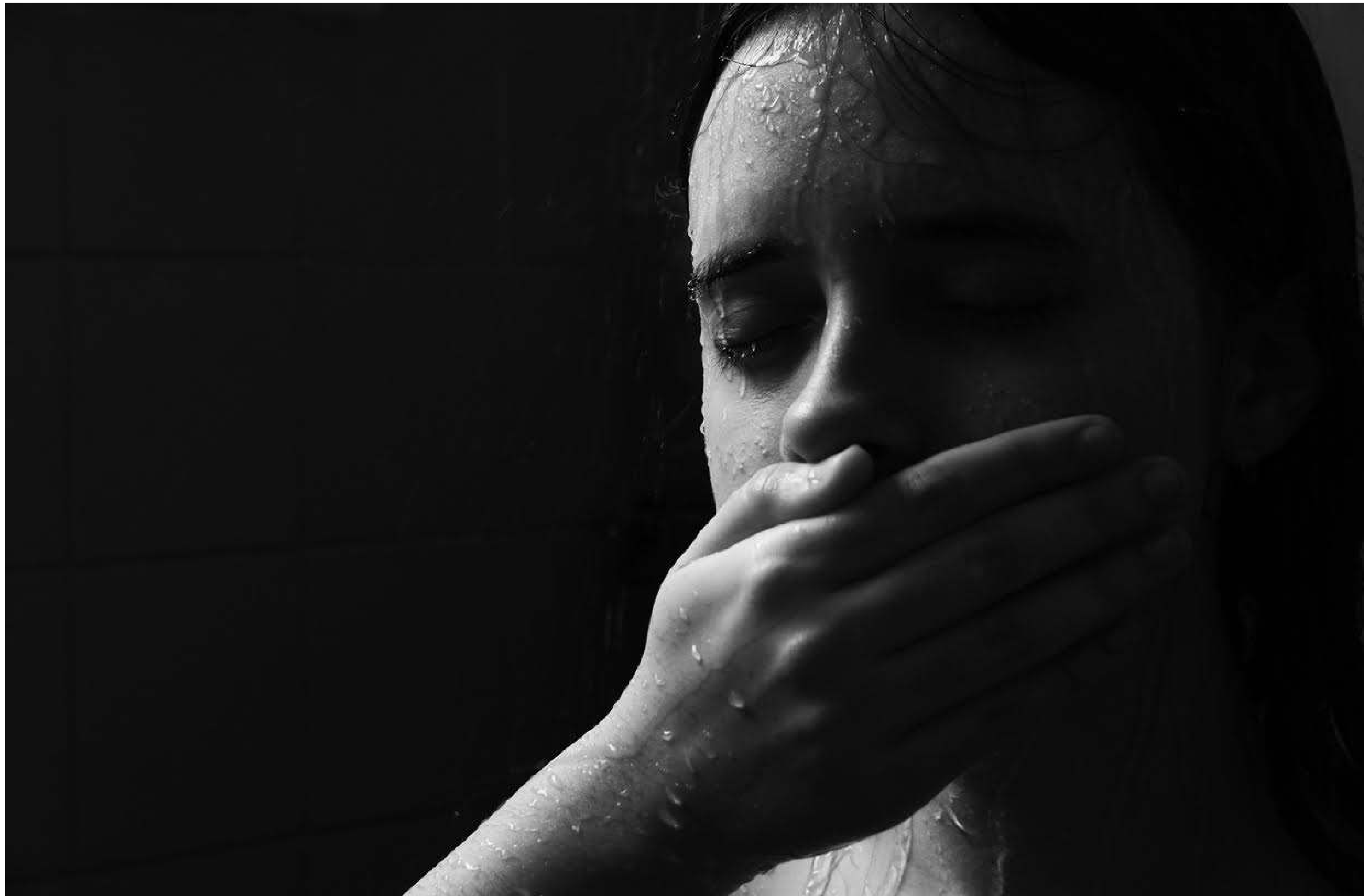
Serie: Responsabilidad social, Sandor Rodríguez. Cuba, 2020.