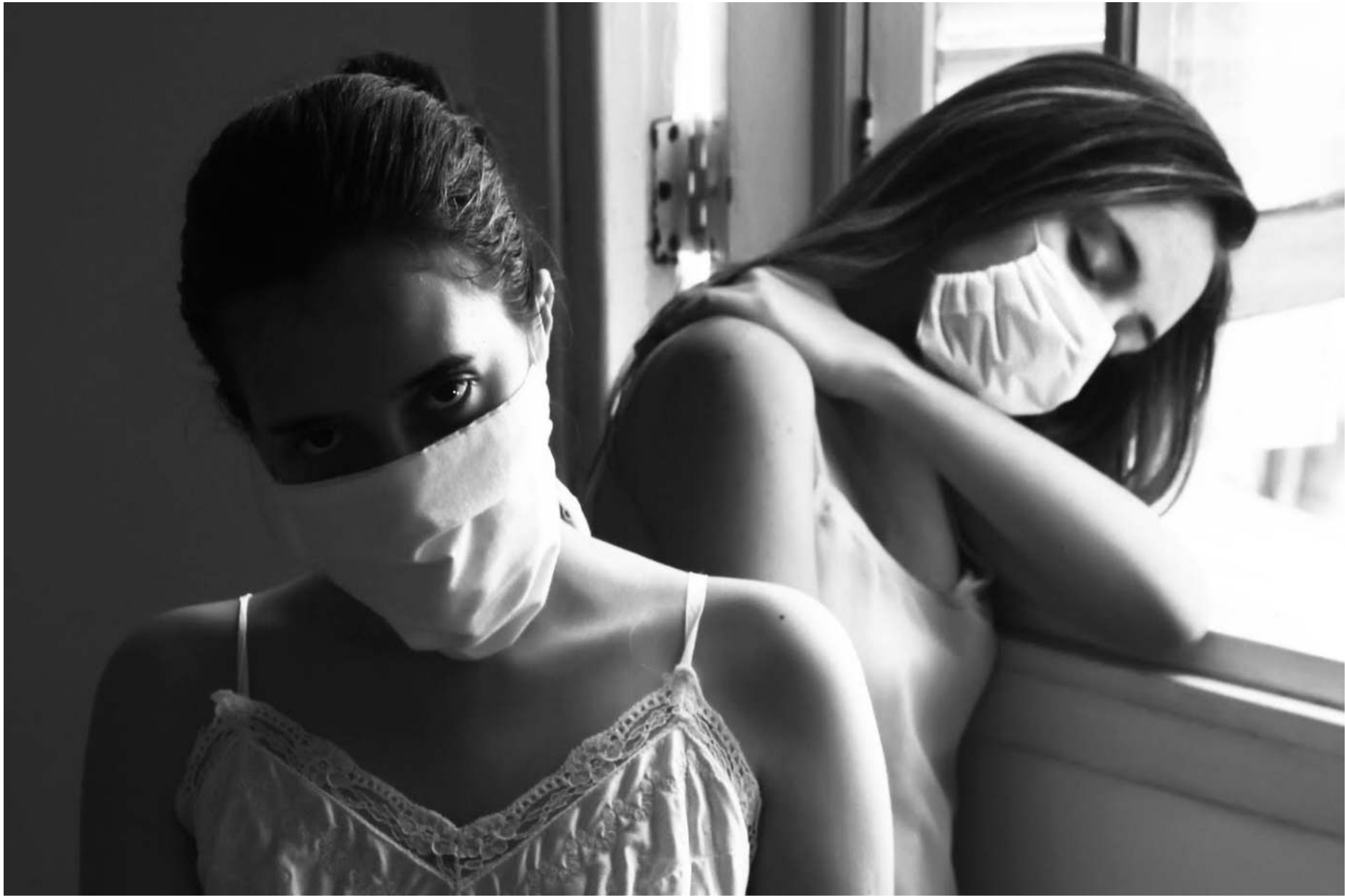
Serie: Virgen a solas, Lisbet Goenaga. Cuba, 2020.