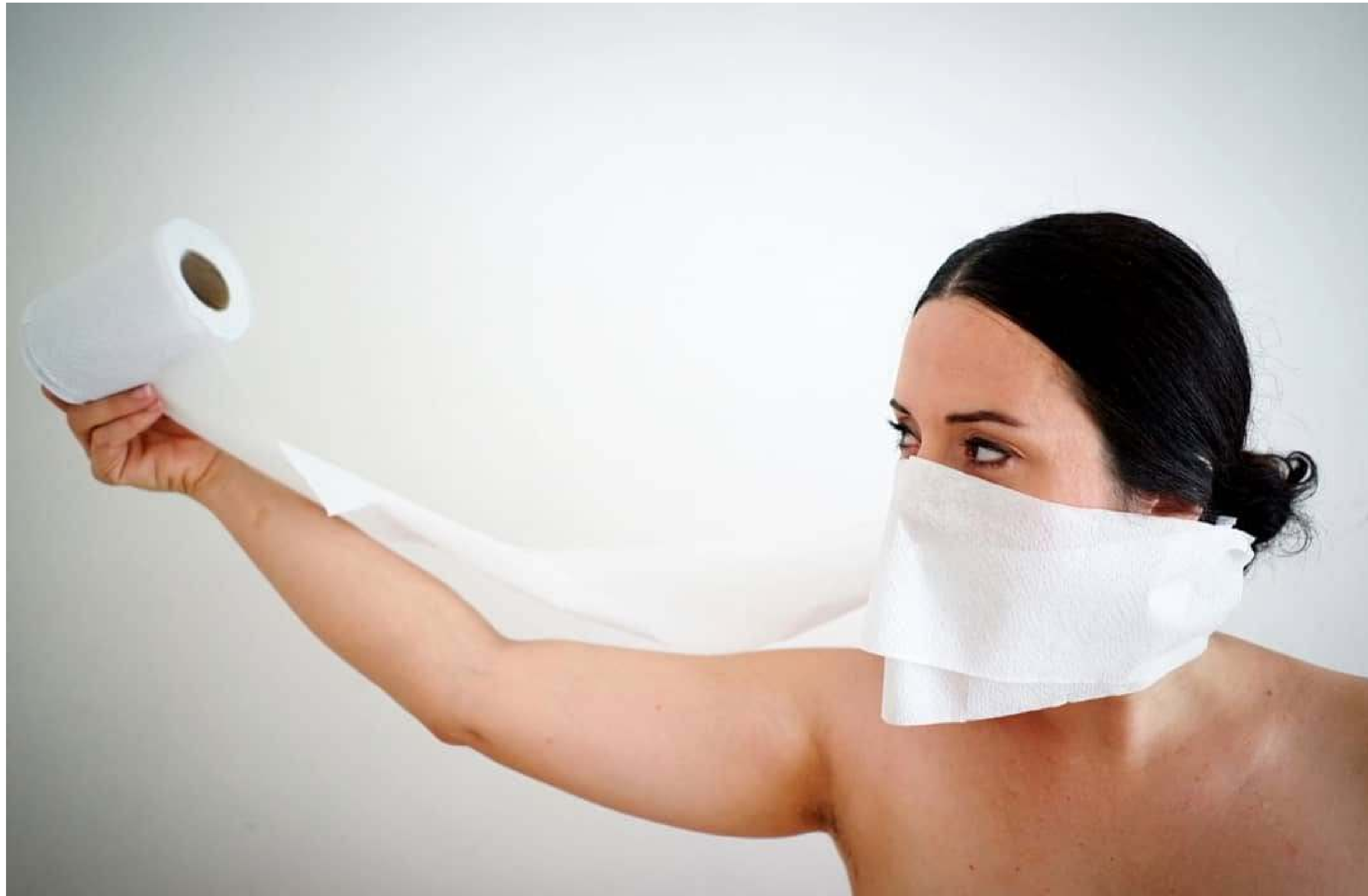
Serie: Virgen a solas, Lisbet Goenaga. Cuba, 2020.