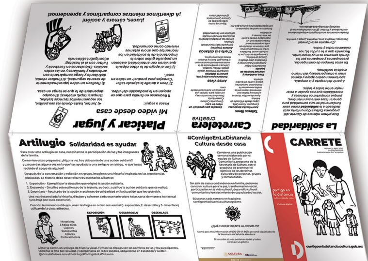
Lado 1 Figura B

1. Descargamos el contenido de Carrete y lo imprimimos por los dos lados de una hoja tamaño carta.